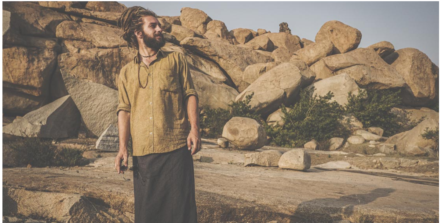
Marcus Gad © DR

D e dertiende editie van Jam'in Jette biedt een eclectisch programma, met maar liefst 20 muziekgroepen, straatkunst, kinder- en volwassenenanimatie, een ambachtsdorp, verenigingen, wereldkeuken,... En dat alles in een unieke, gezellige sfeer.